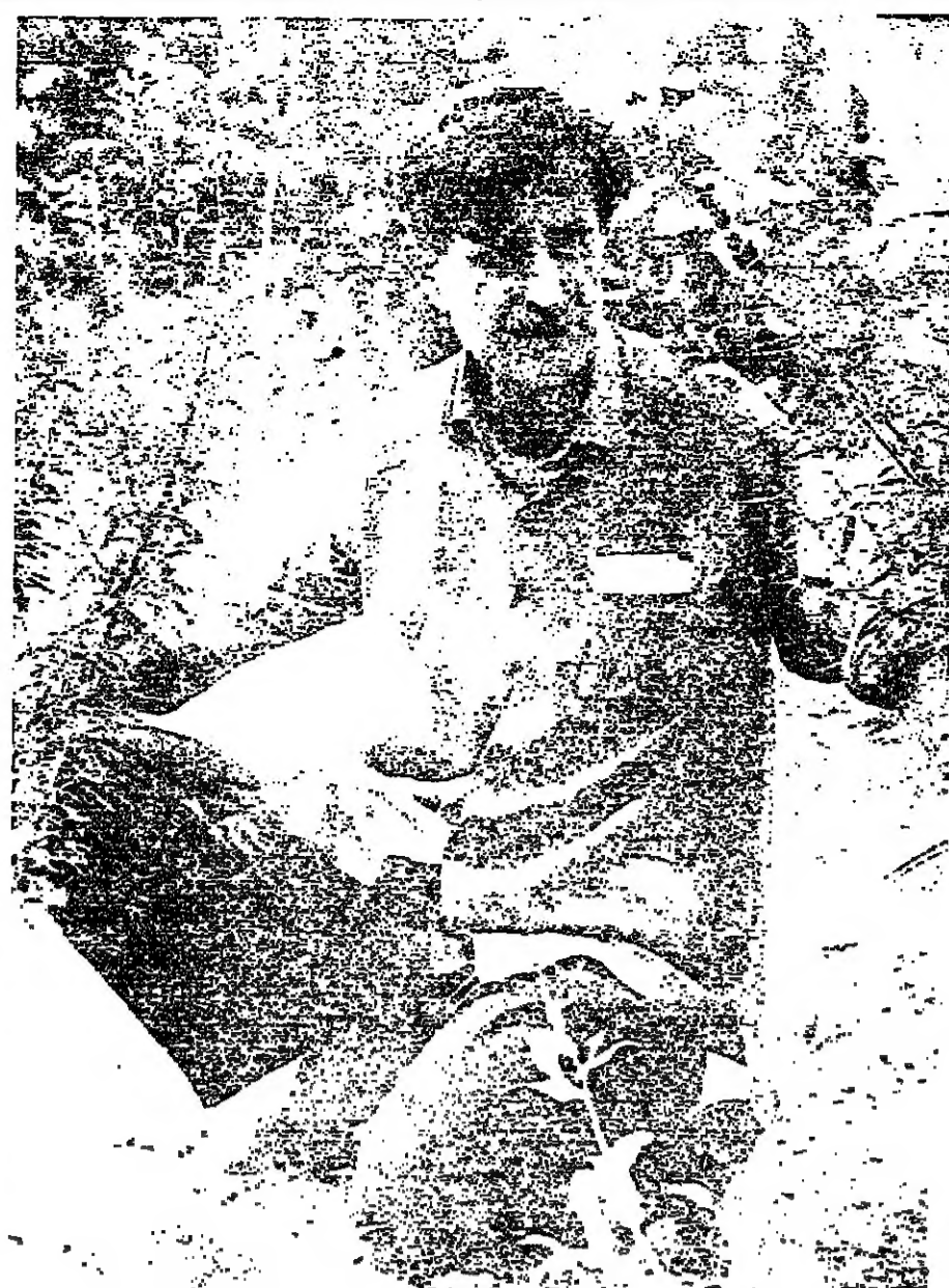
■ في حديقة قصر المخزارة ■